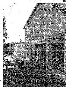
Alterações de trânsito junto ao Colégio N.ª Sr.ª de Fátima

A alteração "deve-se à constatação de que a rua não apresenta condições de circulação viária, originando enganos constantes por parte de veículos que utilizam GPS, de-